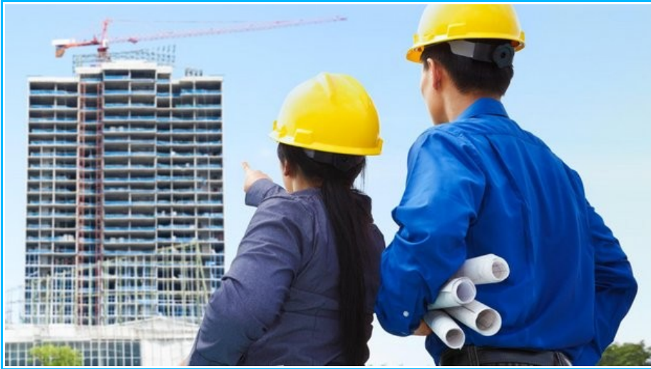
Imagem5- Técnicos de engenharia- Engenheiros