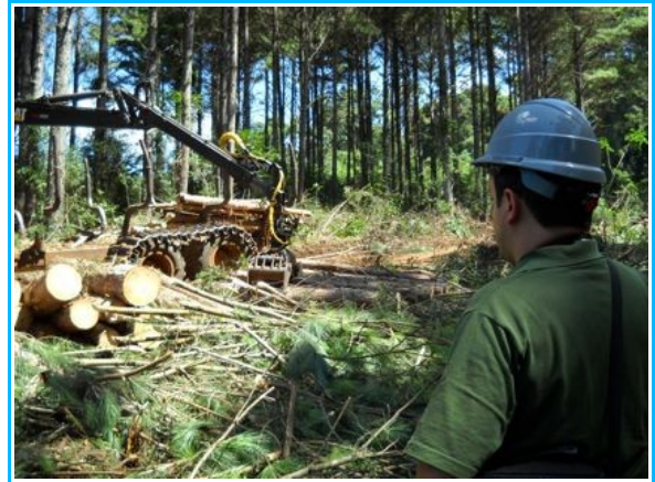
Imagem4- Engenharia florestal