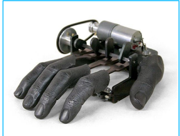
Imagem2- Engenharia de materiais