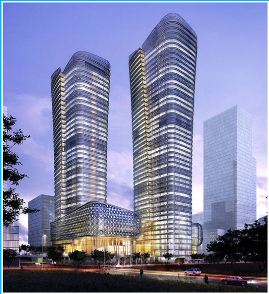
Imagem1- Engenharia de edifícios